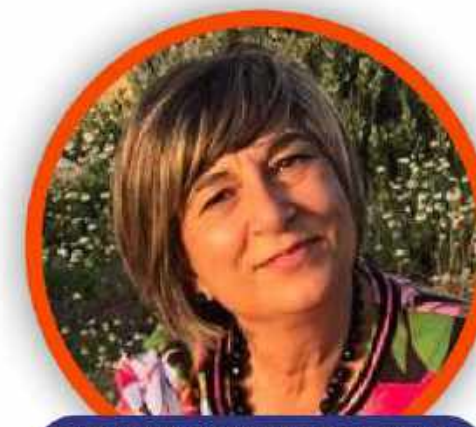
GIOVANNA MARIA BURRELLI SCUOLA PRIMARIA